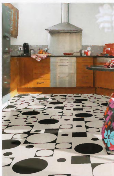
Sol en PVC disponible en rouleaux de 2 et 4 m. À partir de 8 €/m 2 , Collection Design 260, New Generation Modul Black & White, TARKETT.

Les carrelages, le PVC et les stratifiés spéciaux s'entretiennent d'un coup de serpillière humide. En ce qui concerne le bois, la vitrification est déconseillée car elle ne supporte pas l'eau stagnante, en particulier dans la salle de bains. Pour que l'eau ne pénètre pas mais perle sur le bois, l'huile est le traitement le mieux adapté. Les parquets huilés peuvent ainsi être lavés à l'aide d'un savon spécial. En revanche, il faut renouveler régulièrement l'application d'huile afin de préserver la protection. Quant au béton lissé, il est recouvert le plus souvent d'une cire ou d'un vernis, ce qui facilite l'entretien de la matière. ©